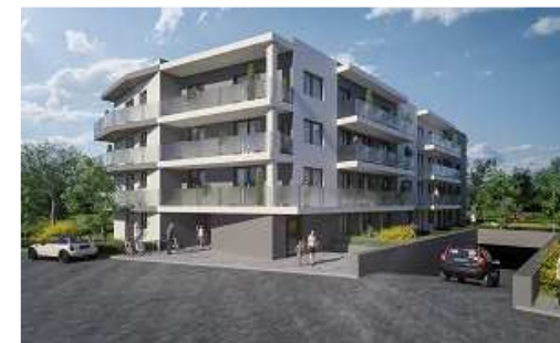
Budynek przy ulicy Budowlanych w Górze Kalwarii